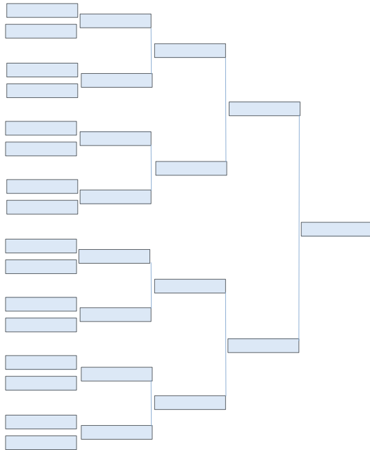
Quadre de 1rs/es i 2ns/es

Es respectaran els caps de cada grup i es distribuïran de manera equitativa a la fase eliminatòria. L'estructura serà aproximadament la següent depenent del volum de participació: